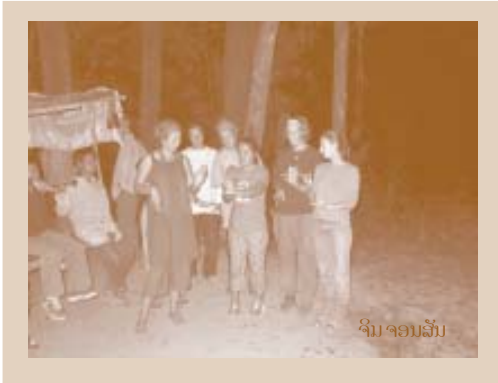
ຈິນ ຈອນລິ້ນ

ໃນເມື່ອສາທິດ ສິ່ງໃດສິ່ງໜຶ່ງ ທີ່ມີການສັບສົນຂຶ້ນ, ທ່ານຄວນຈະແຍກ ການສາທິດ ອອກເປັນຫລາຍພາກ ເພື່ອເຮັດໃຫ້ມັນງ່າຍຂຶ້ນ. ຄືກັບການ ກິນຊີ້ນສະເຕັກ (ຊີ້ນປຸງໃຫຍ່), ການຕັດ ຫລື ແຍກ ການສາທິດອອກ ເປັນຫລາຍປ່ຽງນ້ອຍ ແລະ ເຮັດໃຫ້ເຂົ້າໃຈງ່າຍກວ່າເກົ່າ.