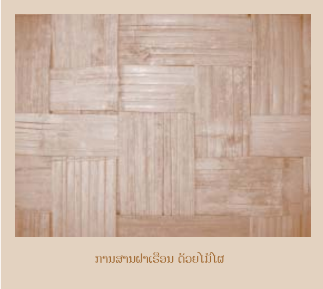
ການສານຝາເຮືອນ ດ້ວຍໄມ້ໃຫຍ່

ຊາວບ້ານ ຂອນ, ບ້ານໄທຍວນສ່ວນຫລວງຫລາຍ ຕັ້ງຢູ່ຕົວເມືອງ ນ້ຳທາ, ປະເພນີ ຫລື ຮິດຄອງເດີມການປຸກເຮືອນ ຂອງເຂົາເຈົ້າ ແມ່ນ ໃຊ້ປະເພດໄມ້ໃຫຍ່ສຳລັບເຮັດຝາເຮືອນ ແລະ ໄມ້ຊະນິດອື່ນໆ ສຳລັບເຮັດຂອບ ແລະ ເສົາເຮືອນ. ເຂົາເຈົ້າປຸກເຮືອນຕົນເອງເທິງໜ້າດິນ, ການອອກແບບກໍ່ສ້າງທີ່ເຄີຍເຮັດຜ່ານມາ ໄດ້ຖືກນຳໃຊ້ໃນທົ່ວປະເທດລາວ ເພື່ອໃຫ້ເປັນສະຖານທີ່ ສຳລັບຜັບມ້ວນ ເຄື່ອງຂອງຕ່າງໆ ຢູ່ກ້ອງຕະລ່າງເຮືອນ, ຮິນສຳລັບເດືອນທີ່ມີອາກາດຮ້ອນ ແລະ ປ້ອງກັນຈາກນ້ຳຖ້ວມ. ຍ້ອນວ່າບັນດາເຮືອນ ທີ່ເຮັດດ້ວຍວັດຖຸຕ່າງໆ ຈາກທຳມະຊາດມັນຈຶ່ງຖືກທຳລາຍງ່າຍ ຈາກ ແມງໄມ້ຊະນິດຕ່າງໆ.