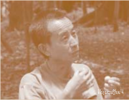
ຄຶດສະເປັນເຈົ້າ