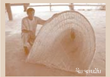
ໂຊ ສຳລັບຈັບປາໃຫຍ່

ຊາວບ້ານເຂດ ດອນແດງ, ເມືອງ ປະທຸມພອນ, ແຂວງ ຈຳປາສັກ ອະ ທ ັ ບ າ ຍ ວ ັ ທ ັ ກ າ ນ ນຳໃຊ້ ອຸປະກອນຈັບປາແບບພິ້ນເມືອງ, ຊຶ່ງເອີ້ນວ່າ(ຂາ). ຂາ ແມ່ນໂຊປາໃຫຍ່ ມີປາກ