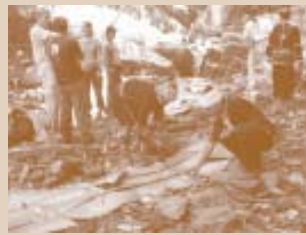
ອາຫານໄດ້ຈັດວາງ ເທິງໃບກ້ວຍ ເປັນທີ່ຮຽບຮ້ອຍ

6. ອາຫານໄດ້ຖືກຈັດ ຢູ່ເທິງໃບຕອງກ້ວຍ ຫລື ໃບໄມ້ຊະນິດຕ່າງໆ. ຊາວບ້ານ ບໍ່ໃຊ້ປະເພດເຄື່ອງຢາງ ເຊັ່ນ: ຖ້ວຍ, ຈານ, ຈອກ ຫລື ແນວຮອງຈອກ ແລະ ອື່ນໆ ເພາະວ່າ ນັ້ນອາດບໍ່ແມ່ນ ປະເພນີ ແລະ ບໍ່ເໝາະສົມສຳລັບນັກທ່ອງທ່ຽວ.