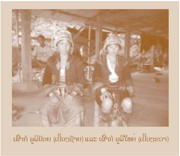
ເຜົ່າກໍ ພູລິນ້ອຍ (ເບື້ອງຊ້າຍ) ແລະ ເຜົ່າກໍ ພູລິໃຫຍ່ (ເບື້ອງຂວາ)

ເຄື່ອງນຸ່ງແບບພື້ນເມືອງໃດ ທີ່ເປັນ ຂອງບ້ານ ຫລື ຊົນເຜົ່າຂອງທ່ານ ? ຈົ່ງສົນທຽບຄວາມແຕກຕ່າງ ລະ ຫວ່າງການນຸ່ງຖື ແບບປະເພນີ ຂອງທ່ານ ແລະ ນາດຕະຖານການ ນຸ່ງຖືແບບປະເພນີລາວ. ຖ້າວ່າການ ນຸ່ງຖື ແບບປະເພນີຂອງທ່ານ ຄືກັນ ກັບ ການນຸ່ງຖືແບບປະເພນີລາວ. ທ່ານສາມາດອະທິບາຍຄວາມແຕກ ຕ່າງໃດໜຶ່ງ ໃນລວດລາຍຜ້າ ຂອງ ທ່ານໄດ້ບໍ່ ?