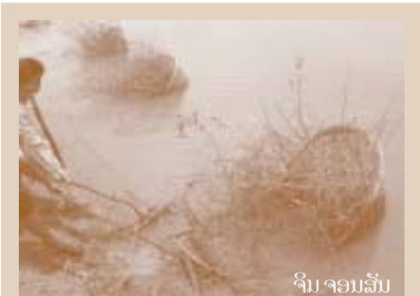
ຊາວບ້ານ ກຳລັງກະກຽມໂຊ ໄປໃສ່ປາ

ການໃສ່ໂຊຊະນິດນີ້ ເພິ່ນເອົາໄປໄມ້ ແລະ ເຫຍື່ອລ້ຄີ: ກະດູກງົວ, ຄວາຍ ຍັດໃສ່ ໃນໂຊເອົາໂຊແຊ່ນ້ຳທີ່ເລິກສົມຄວນ ປິ່ນປາກໂຊ ໃຫ້ຂະໜານກັບສາຍນ້ຳ ເມື່ອປາ ລອຍມາເຫັນຈະພາກັນເຂົ້າໄປຊິ້ນຢູ່ໃນໂຊ ຊຶ່ງມີໄປໄມ້ ແລະ ກະດູກເໝັ້ນ. ການ ໃສ່ໂຊ ແມ່ນແຊ່ປະໄວ້ຄ້າງຄິນ, ຕອນເຊົ້ານີ້ຕໍ່ມາຈຶ່ງດິງຂຶ້ນມາເທິງບົກ ເພື່ອເກັບ ເອົາປາ. ການກູ້ໂຊ ແມ່ນດິງເຊືອກ ທີ່ມັດໃສ່ຫາງໂຊຂຶ້ນເທິງບົກ ໂດຍບໍ່ຕ້ອງລົງ ນ້ຳໃຫ້ປຽກຕົນໂຕ.