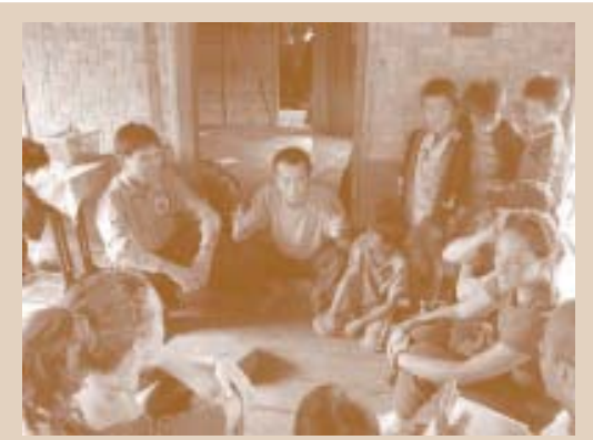
ຮູບຂອງພະນັກງານນຳທ່ຽວຂັ້ນບ້ານ ກຳລັງເວົ້າ ແລະ ພະນັກງານນຳທ່ຽວຂັ້ນແຂວງ ກຳລັງແປພາສາ

ຜູ້ນຳທ່ຽວຂອງບ້ານຫລາຍຄົນ ຈະໃຊ້ເວລາຢ່າງໜ້ອຍໜຶ່ງ ເຖິງ ສອງ ປີ ເຮັດວຽກກັບຜູ້ແປພາສາ ຈົນກະທັ້ງເຂົາເຈົ້າ ມີຄວາມ ສາມາດດຳເນີນໃນການເວົ້າ ພາສາຕ່າງປະເທດຂັ້ນພື້ນຖານ ທີ່ຈຳເປັນ ສຳລັບການອະທິບາຍ ໃຫ້ນັກທ່ອງທ່ຽວ. ເພື່ອນຳໃຊ້ ພາສາໃຫ້ຖືກຕ້ອງ ແມ່ນຕ້ອງໃຊ້ເວລາ ໃນການຝຶກພິມຄວນ ເພື່ອໃຫ້ມີຄວາມຊຳນິຊຳນານ . ປັດໃຈຕໍ່ໄປນີ້ ແມ່ນສຳລັບ ການແປພາສາທີ່ຄວນເອົາໃຈໃສ່.