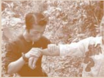
ພະນັກງານນຳທ່ຽວສອງທ່ານນີ້ ສາທິດ ວິທີ ປົວກັນໂດຍຜ່ານການເປົ່າ

ສຳນຽງ: ທ່ານຄວນຈະປ່ຽນສຳນຽງຂອງສຽງ ເພື່ອເນັ້ນໜັກຄວາມຮູ້ສຶກຕ່າງໆ ທີ່ແຕກຕ່າງກັນ. ຕົວຢ່າງ: ຖ້າທ່ານກຳລັງອະທິບາຍສັດຕົວໜຶ່ງ ກຳລັງຈັບເຫຍື່ອ ຂອງມັນດ້ວຍວິທີໃດ ຫລື ແບບໃດ, ທ່ານອາດຈະເລີ່ມທຳອິດ ດ້ວຍສຽງທີ່ອ່ອນນຸ້ມ ເພື່ອເນັ້ນໂຕສັດນັ້ນ ກຳລັງເຄື່ອນຍ້າຍໆບູບູ ຜ່ານປ່າ. ຫລັງຈາກນັ້ນ ທ່ານອາດສືບຕໍ່ ດ້ວຍນ້ຳສຽງດັງຂຶ້ນ ແລະ ດັງຂຶ້ນກວ່າເກົ່າ ຈົນເຖິງຂຶ້ນສຸດທ້າຍ ທີ່ສັດຕົວດັງກ່າວ ຂ້າເຫຍື່ອຂອງມັນ. ຖ້າວ່າທ່ານທົດແທນ ແບບນ້ຳສຽງໂທນດຽວ ບໍ່ມີສຽງຂຶ້ນສຽງລົງທີ່ຫລາກຫລາຍ, ນັກທ່ອງທ່ຽວຈະຮູ້ສຶກເບື້ອ ແລະ ບໍ່ມີຄວາມສົນໃຈ.