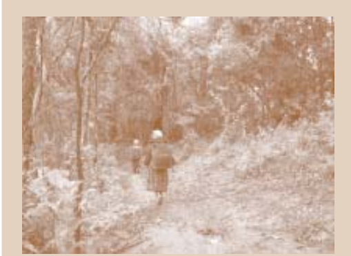
ນາງ ມິເຊາະ ແລະ ນາງ ແຊເຊີ ກຳລັງຮ້ອງເພງ ໃນຂະນະທີ່ເຂົາເຈົ້າຍ່າງປ່າ

“ເອົາສິ່ງໃດ ສິ່ງໜຶ່ງ ໃຫ້ພວກເຮົາຊົງຈຳ ສຳລັບນີ້ນີ້ . ພວກເຮົາຮ້ອງເພງຕາມຄວາມຮູ້ສຶກ. ຄືພວກເຮົາຮ້ອງເພງນີ້ ພວກເຮົາໄດ້ຈື່ທຸກຄົນ ທີ່ໄດ້ມາຍ່າງເສັ້ນທາງນີ້ ກ່ອນພວກເຮົາ. ເມື່ອນົກບິນ ຢູ່ເທິງທ້ອງຟ້າ ຢ່າລົມຫລຽວຂຶ້ນເທິງ ແລະ ຖ້າວ່ານົກບິນລັບຂອບຟ້າ, ບໍ່ຕ້ອງຢຸດຮ້ອງເພງ. ເວລາເຈົ້າຫລຽວເບິ່ງທາງໜ້າ, ຢ່າລົມຫລຽວເບິ່ງທາງຫຼັງ. ສິ່ງທີ່ພວກເຮົາຮ້ອງໃນນີ້ນີ້, ຢ່າລົມນີ້ອີ້ນ, “