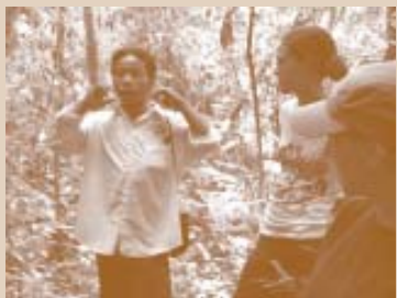
ຜູ້ນຳທ່ຽວຄົນນີ້ ບໍ່ຮູ້ເວົ້າ (ຫຼືໝວກ) ພາສາອັງກິດ; ສະນັ້ນ, ລາວໃຊ້ການກະທຳ ເພື່ອອະທິບາຍ ຄວາມໝາຍວ່າແນວໃດ

ການສະແດງທ່າທາງ : ໃຊ້ມືຂອງທ່ານ, ແຂນ ແລະ ຮ່າງກາຍຂອງທ່ານ ເພື່ອຊ່ວຍທ່ານ ໃນການອະທິບາຍໃຫ້ມີຄວາມປະທັບໃຈກວ່າເກົ່າ. ການເບິ່ງຜູ້ໃດຜູ້ໜຶ່ງຍືນຊື່ງ ໃນຂະນະທີ່ ເຂົາເຈົ້າເວົ້າຢູ່ອາດຈະເຮັດໃຫ້ເບື້ອຫລື ເຊັ່ງ. ນັກສະແດງຜູ້ທີ່ໃຊ້ການເຄື່ອນໄຫວແມ່ນ ສະໝຸກສະໜານ ທີ່ຈະເບິ່ງ; ນັກສະແດງຜູ້ມີແຕ່ເວົ້າ ຈະເຮັດໃຫ້ເຮົາເຫງົາອນ. ຈົ່ງຊີ້ບອກສິ່ງຂອງຕ່າງໆ; ໃຊ້ແຂນຂອງທ່ານ ເພື່ອຊີ້ບອກບາງສິ່ງບາງຢ່າງ ທີ່ຄ້າຍຄືກັນ; ສ້າງພຶດຕິກຳ ເພື່ອຊ່ວຍນັກທ່ອງທ່ຽວ ວາດພາບທ່ານອະທິບາຍ ກ່ຽວກັບຫຍັງ ຫລື ເຄື່ອນຍ້າຍໄປມາເລັກນ້ອຍ ເພື່ອໃຫ້ຜູ້ຄົນເຫລົ່ານັ້ນ ບໍ່ເບື້ອທີ່ແນມເບິ່ງທ່ານ.