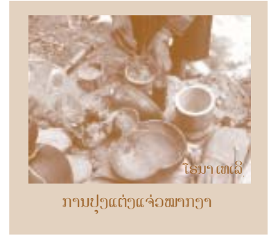
ໂຮນາເທລີ

4. ອາຫານອື່ນໆ ກໍ່ປຸງແຕ່ງຄືກັນ, ເຊັ່ນ: ແຈ່ວໝາກເຜັດ ຊຶ່ງປະສົມດ້ວຍໝາກງາ ແລະ ປຶ້ງໂກ່ ເທິງກອງຖ່ານ.