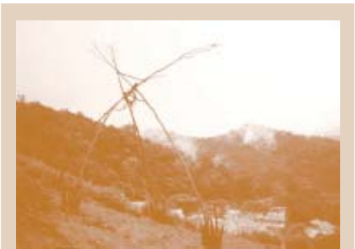
ມັນເປັນຂໍ້ທ້າມ (ສິ່ງຂະລຳ) ທີ່ຈະໃຊ້ໂອນຊາ ຂອງ ເຜົ່າກໍ ໃນໄລຍະທີ່ບໍ່ແມ່ນປີໃໝ່ ຂອງເຂົາເຈົ້າ

ທາງເລືອກທີ່ດີທີ່ສຸດ ສຳລັບນັກທ່ອງທ່ຽວ ເພື່ອຮຽນຮູ້ກ່ຽວກັບສິ່ງໃດສິ່ງໜຶ່ງ ແລະ ສິ່ງທີ່ສະໜຸກສະໜານມ່ວນຊື່ນ ສຳລັບເຂົາເຈົ້າ ແມ່ນໄດ້ເຂົ້າຮ່ວມຕົວຈິງ ໃນກິດຈະກຳຂອງທ້ອງຖິ່ນ. ເຖິງແມ່ນວ່ານັກທ່ອງທ່ຽວ ຢູ່ໃນໄລຍະ ພັກແລ້ງກໍຕາມ, ນັກທ່ອງທ່ຽວຈຳນວນໜຶ່ງ ອາດຈະມັກຊ່ວຍຊາວບ້ານ ເຮັດວຽກປະຈຳວັນຂອງຊາວບ້ານ. ນັກທ່ອງທ່ຽວຫລາຍຄົນບໍ່ຖືສາ ເລື່ອງການເປື້ອນເລັກໆ ຫນ້ອຍໆ ແລະ ພະຍາຍາມຊອກຮູ້ສິ່ງໃໝ່ໆ.