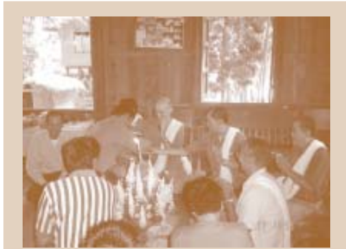
ການສະແດງ ຫລື ການເຮັດພິທີບາສີ ແມ່ນສິ່ງໜຶ່ງທີ່ທ່ານສາມາດເຮັດ ໃນເມື່ອນຳທ່ອງທ່ຽວມາຢ້ຽມຢາມບ້ານຂອງທ່ານ

ຖ້າທ່ານໝັ້ນໃຈວ່າສິ່ງໃດທີ່ແມ່ນຄວາມບໍ່ເໝາະສົມທາງດ້ານວັດທະນະທຳ ທີ່ຈະສະແດງ/ ສາທິດ, ທ່ານບໍ່ຈຳເປັນທີ່ຈະເຮັດການສະແດງ. ຕົວຢ່າງ : ເຜົ່າກໍ (ອາຄາ) ຄົນໜຶ່ງອາດຈະຮູ້ສຶກໜ້າອາຍທີ່ສະແດງວິທີນຳໃຊ້ ໂອນຊາ ໃນໄລຍະບໍ່ແມ່ນບຸນປີໃໝ່, ເພາະວ່າມັນເປັນສິ່ງທີ່ຂະລຳ ທີ່ຈະ ສະແດງ ຫລື ສາທິດ. ໃນກໍລະນີທີ່ພະນັກງານນຳທ່ຽວ ບໍ່ອາດຮຽກຮ້ອງໃຫ້ມີການສາທິດ ຫລື ສະແດງ ແລະ ທ່ານສາມາດທົດແທນການສະແດງນັ້ນດ້ວຍການອະທິບາຍ ການນຳໃຊ້ ໂອນຊາ ໂດຍບໍ່ໄດ້ມີການສະແດງວິທີນຳໃຊ້ ໂອນຊາ.