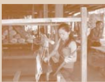
ເພດຍິງ ມີຄວາມຮູ້ ແລະ ປະສົບການ ທ້ອງຖິ່ນ ທີ່ສຳຄັນຫລາຍທີ່ສຸດ ເຊັ່ນ: ຊ່າງຕຳຜ້າໄໝ

ມັນມີພຽງແຕ່ຄົນອະວຸໂສເທົ່ານັ້ນບໍ່ ທີ່ມີຄວາມຮູ້ ແລະ ປະສົບການທ້ອງຖິ່ນ ? ມັນເປັນຄວາມຈິງທີ່ຜູ້ອາວຸໂສມີຄວາມຮູ້ ແລະ ປະສົບການ ທ້ອງຖິ່ນຫລາຍ. ພວກເຮົາຈຳເປັນຕ້ອງເຂົ້າໃຈວ່າ ຄວາມຮູ້ທ້ອງຖິ່ນນີ້ ຕ້ອງຖ່າຍທອດ ໃຫ້ແກ່ຄົນຮຸ້ນໃໝ່. ຊາວໜຸ່ມສາມາດມີຄວາມຮູ້ທ້ອງຖິ່ນເຊັ່ນກັນ. ໃນຕົວຈິງ, ຄວາມຮູ້ທ້ອງຖິ່ນມີຫລາຍປະເພດ ທີ່ໄດ້ ຖືກນຳໃຊ້ ໂດຍຊາວໜຸ່ມ ແລະ ຜູ້ເຖົ້າເຂົ້າໃນຊີວິດປະຈຳວັນ ເຊັ່ນ: ວິທີການ ໃນການປູກຝັງ ແລະ ລ້ຽງສັດ, ຫາປາ, ປຸງແຕ່ງອາຫານ ແລະ ບັນດາວຽກ ທີ່ເຮັດປະຈຳວັນ. ມັນມີພຽງແຕ່ ເພດຊາຍ ເທົ່ານັ້ນບໍ່ ທີ່ມີຄວາມຮູ້ ແລະ ປະສົບການທ້ອງຖິ່ນ? ທັງເພດຊາຍ ແລະ ເພດຍິງ ລ້ວນແລ້ວແຕ່ມີຄວາມຮູ້ທ້ອງຖິ່ນ ມີຫລາຍກິດຈະກຳ ທີ່ເພດຍິງຮັບຜິດຊອບ, ຊຶ່ງເພດຊາຍບໍ່ໄດ້ຮັບຜິດຊອບ ແລະ ກົງກັນຂ້າມມີຫລາຍກິດຈະກຳທີ່ເພດຊາຍ ຮັບຜິດຊອບ, ຊຶ່ງເພດຍິງບໍ່ໄດ້ຮັບຜິດຊອບ. ຕົວຢ່າງ: ໃນຫລາຍໆ ບ້ານຢູ່ ສປປ ລາວ ຕາມປົກກະຕິແລ້ວ ເພດຍິງຈະຮູ້ກ່ຽວກັບ ການຕຳຫຼຸກທໍໄໝ ຫລາຍກວ່າ ເພດຊາຍ, ໃນຂະນະທີ່ເພດຊາຍກໍມີຄວາມຮູ້ ແລະ ປະສົບການ ຫລາຍກວ່າເພດຍິງ ກ່ຽວກັບວຽກຈັກສານ. ຄວາມຮູ້ທີ່ເພດຍິງມີ ກ່ຽວກັບ ການປູກພືດ ແລະ ເຮັດສວນ, ລ້ຽງສັດ, ລ້ຽງລູກເຕົ້າ, ຜະລິດເຄື່ອງຫັດ ຖະກຳ, ປຸງແຕ່ງອາຫານ, ເກັບກູ້ບັນດາເຄື່ອງປ່າຂອງດົງ ແລະ ຫລາຍໆ ກິດຈະກຳອື່ນອີກ ທີ່ສຳຄັນ ແລະ ເປັນທີ່ໜ້າສົນໃຈ ສຳລັບນັກທ່ອງທ່ຽວ.