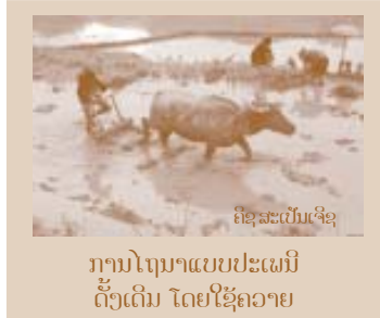
ຄູສະເປັນເອີຊ ການໂຖນາແບບປະເພນີດັ້ງເດີມ ໂດຍໃຊ້ຄວາຍ