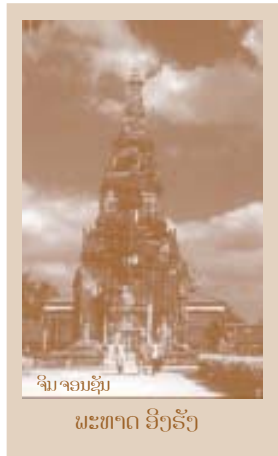
ຈີນຈອນຊິນ ພະທາດ ອົງຮັງ

ຖ້າທ່ານຮູ້ ປະຫວັດຂອງພະທາດອົງຮັງ ຊຶ່ງເປັນສະຖານທີ່ ສັກສິດແຫ່ງໜຶ່ງໃນ ພາກໃຕ້ ຂອງ ປະເທດລາວ, ທ່ານຈະຮູ້ວ່າ ເປັນຫຍັງທາດແຫ່ງນີ້ ຈິ່ງມີຊື່ວ່າ ອົງຮັງ. ຊາວບ້ານໄດ້ ເວົ້າວ່າ ຢູ່ທີ່ນີ້ ປະມານພັນປີ ກ່ອນໜ້ານີ້, ພະພຸດທະເຈົ້າໄດ້ສະເດັດມາຜ່ານເຂດນີ້ ແລະ ຫລັງຈາກເພິ່ນ ໄດ້ສັນຊົນໝູຈາກທ້ອງຖິ່ນ, ເພິ່ນໄດ້ເກີດອາການເຈັບໜ້າ ແລະ ໄດ້ຢຸດພັກ ເຊົາ. ຢູ່ທີ່ນີ້ ເພິ່ນໄດ້ຍິນອີງ ຕົ້ນຮັງ ສະນັ້ນ, ຫລັງຈາກ ທາດໄດ້ຖືກສ້າງຂຶ້ນ ເພິ່ນຈິ່ງໄດ້ໃສ່ ຊື່ວ່າ: ທາດອົງຮັງ.