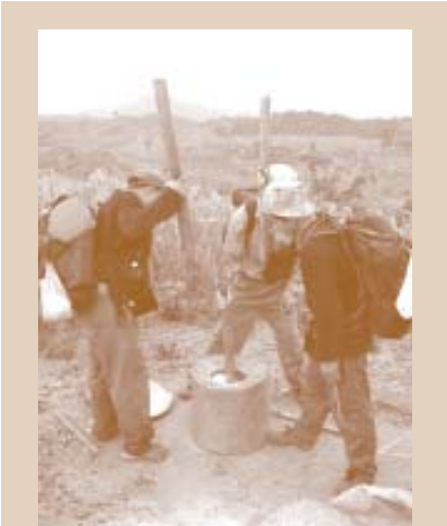
ບັນດາ ຜະນົກງານນຳທ່ຽວນີ້ ກຳລັງສາທິດວິທີຕຳເຂົ້າ

ນັກທ່ອງທ່ຽວສ່ວນຫລາຍ ບໍ່ເຄີຍຕຳເຂົ້າ. ຖ້າທ່ານຕ້ອງການສາທິດ ວິທີຕຳເຂົ້າໃສ່ ຄົກມອງ. ທ່ານສາມາດສາທິດໃຫ້ນັກທ່ອງທ່ຽວຮູ້ ກ່ຽວກັບ ເຂົ້າເປືອກ ແລະ ພິສູດ ວິທີເອົາເຂົ້າໃສ່ຄົກມອງ. ຫລັງຈາກນັ້ນ, ທ່ານກໍ່ນຳ ເອົາສາກ ມາຕຳເຂົ້າດັ່ງກ່າວ ສອງ ເຖິງ ສາມຄັ້ງ. ຂັ້ນຕອນສຸດທ້າຍ, ທ່ານ ອາດສາທິດ ໃຫ້ນັກທ່ອງທ່ຽວເຫັນຄວາມແຕກຕ່າງ ຂອງເຂົ້າກ່ອນ ຕຳ ແລະ ຫລັງການຕຳ. ນັກທ່ອງທ່ຽວອາດຈະເຂົ້າໃຈໄວວ່າສິ່ງນີ້ ແມ່ນ ໃຊ້ສຳລັບເຮັດຫຍັງ. ຕອນນີ້ບໍ່ມີຄຳເວົ້າ ມີແຕ່ການກະທຳຕົວຈິງ.