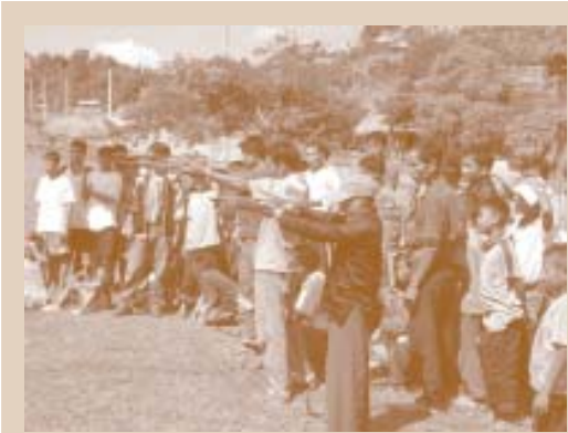
ງານແຂ່ງຂັນ ຍິງໜ້າເກັກ ຢູ່ເມືອງ ວຽງພູຄາ ແຂວງ ຫລວງນໍ້າທາ

ກ່ອນຈະເອົາລູກໜ້າໄປຍິງຈາກໜ້າເກັກນີ້, ລູກໜ້າຈະຕ້ອງໄດ້ເອົາໄປຫາໃສ່ຢາພິດທຳມະຊາດ ຫຼື ເອີ້ນວ່າ ໜ້ອງ ເສຍກ່ອນ ຈຶ່ງເອົາໄປຍິງໄດ້. ຢາພິດນີ້ເອົາມາຈາກຕົ້ນສັບ ເອີ້ນວ່າໜ້ອງ. ຊຶ່ງເປັນຢາພິດ ທີ່ມີລິດສູງ ແລະ ຖ້ານາຍພານບັງເອີນຖືກລູກໜ້າໜ້ອງບາດ ຫຼື ລູກໜ້າໜ້ອງຂິດໃສ່ຮອຍບາດ ລາວກໍ່ຈະຕາຍ. ຢູ່ບ້ານຕະອອງຍັງໂຊກດີ ເພາະວ່າເຂົາເຈົ້າສາມາດປິ່ນປົວອາການນີ້ ໄດ້ຜູ້ທີ່ຖືກບາດເຈັບສາມາດປິ່ນປົວໄດ້ ດ້ວຍການກິນຈີ່ກະປູສິດ. ຊາວບ້ານນີ້ ໄດ້ເອົາໃຈໃສ່ຢາງເຄັ່ງຂັດ ໂດຍບໍ່ເອົາລູກໜ້າໜ້ອງ ໄປວາງໄວ້ຢູ່ໃກ້ກະປູ ເພາະຈະເຮັດໃຫ້ພິດຢາຂອງ ໜ້ອງ ເສຍຄຸນ.