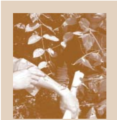
ໃນ ສປປລາວ ມີຜູ້ຄົນບາງຊະນິດ ທີ່ເປັນຢາຜື່ນເນືອງ, ຊຶ່ງມັນໃຫ້ປະໂຫຍດຢ່າງຫລວງຫລາຍ ເຊັ່ນ: ຜິດ ຊະນິດນີ້ ສາມາດຢຸດເສືອດໄຫລໄດ້. ຜິດນີ້ເອີ້ນວ່າ: ຫຍ້າຂົວ ຫລື ຫຍ້າຝະລັ່ງ, ຊຶ່ງຄົນລາວສ່ວນຫລວງ ຫລາຍແມ່ນຮູ້ຈັກກັນດີ ແລະ ມັນມີຢູ່ທົ່ວທຸກແຫ່ງ ໃນ ສປປລາວ. ຜ່ອນກັນນັ້ນ, ມັນຍັງມີປະໂຫຍດ ສຳລັບການປິ່ນປົວກະເພາະລຳໂສ້ອີກດ້ວຍ.

ການຂະຫຍາຍຕົວທີ່ໜ້າເປັນທ່ວງ, ຊຶ່ງການບັງຄັບ ຂອງໂລກທີ່ທັນສະໄໝ ເຊັ່ນ: ໂທລະທັດ, ທຸລະກິດກະສິກຳ ແລະ ສັງຄົມໃນຕົວເມືອງ ຈະປ່ຽນແປງ ປະຊາຊົນທ້ອງຖິ່ນ ແລະ ກຸ່ມຊົນເຜົ່ານັ້ນ ເປັນສາເຫດທີ່ເຮັດໃຫ້ສູນເສຍ ຄວາມຮູ້ ແລະ ປະສົບການທ້ອງຖິ່ນ. ສະຖານະການແບບນີ້ ທ່ານ ຄິດວ່າ ຈະດີບໍ່ ? ມັນອາດຈະສູນເສຍຄວາມຮູ້ ແລະ ປະສົບການ ທີ່ໄດ້ຮັບການ ພັດທະນາມາຕັ້ງຫລາຍຮ້ອຍປີ ແລະ ຈາກຫລາຍຮຸ້ນຄົນບໍ່ ? ມີບາງຂໍ້ມູນ ທີ່ຄົນທ້ອງຖິ່ນ ອາດຈະມີຄວາມຈຳເປັນ ເພື່ອການດູແລສຸຂະພາບ ແລະ ເພື່ອຄວາມຢູ່ລອດ ຂອງໝົດທຸກຄົນໃນໂລກບໍ່ ? ຫລາຍໆຄົນມີຄວາມເຊື່ອ ຖືວ່າ ຄວາມຮູ້ ແລະ ປະສົບການທ້ອງຖິ່ນສຳຄັນທີ່ສຸດ ແລະ ບໍ່ອາດຈະ ສູນເສຍມັນໄປ. ພວກເຂົາເຊື່ອໝັ້ນວ່າ ຄວາມຮູ້ຂອງຊາວພື້ນເມືອງ ຄວນຈະໄດ້ຮັບການສະໜັບສະໜູນ ແລະ ພິຈາລະນາໂດຍ ນັກວິທະ ຍາສາດ, ນັກຮຽນຮູ້ ນັກສຶກສາ, ນັກການເມືອງ ແລະ ກຸ່ມຄົນໃນສັງຄົມ.