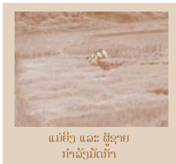
ແມ່ຍິງ ແລະ ຜູ້ຊາຍ ກຳລັງມັດກ້າ