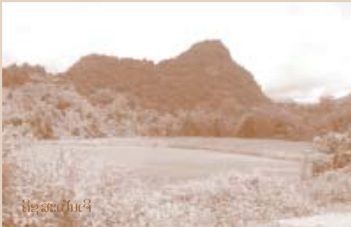
ຄຶດສະເປັນເຈົ້າ

ຕອນເຊົ້າ ທ່ານ ສາມາດໄດ້ຍິນສຽງລົງຮ້ອງເປັນບາງຄັ້ງຄາວ, ໂດຍສະເພາະໃນລະດູໜາວ ແລະ ລະດູແລ້ງ ທ່ານ ລາວປາວ ໄດ້ຊື້ໃຫ້ນັກທ່ອງທ່ຽວເບິ່ງ ໝາກໄມ້ຊະນິດຕ່າງໆ, ຍອດ ແລະ ໃບໄມ້ ທີ່ລົງກິນເປັນອາຫານ, ສ່ວນຫລາຍລົງມັກກິນປະເພດ ໝາກໄມ້. ແຕ່ບາງຄັ້ງ ໃນຍາມບໍ່ມີໝາກໄມ້ ພວກມັນຈະກິນຍອດ ໃບໄມ້ ແລະ ເຄືອໄມ້ ເປັນອາຫານ. ທ່ານ ລາວປາວ ອະທິບາຍວ່າ: ຖ້າຢາກຮູ້ວ່າ ພວກລົງຢູ່ໃກ້ ຫຼື ໂກຈະຕ້ອງເບິ່ງຈາກ ຈຳນວນ ໝາກໄມ້: ຖ້າບໍ່ມີໝາກໄມ້ ເຫລືອ ຢູ່ເປັນຈຳນວນຫລາຍ ພ ວ ກ ເ ຣ ື າ ຈະຮູ້ວ່າ ຈຳພວກລົງໄດ້ອາໄສ ຢູ່ບໍລິເວນນັ້ນ ຍ້ອນວ່າ ພ ວ ກ ເ ຂ ື າ ກ ຳ ລ ັ ງ ກ ື ນ ໝ າ ກ ໄ ມ ີ . ຂຸ້ນທັງໝົດຜູ້ທີ່ໄວ້ວນແຕ່ເປັນສິ່ງທີ່ບໍ່ໃຈ ສຳລັບນັກທ່ອງທ່ຽວ.