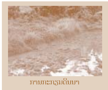
ການກະກຽມດິນນາ